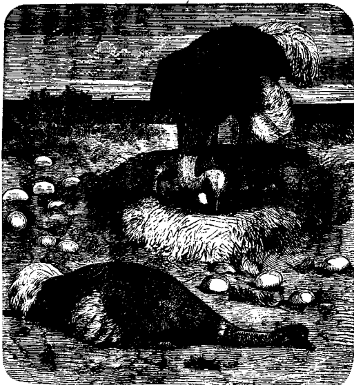
L'autruche et ses œufs.

Gen. xix, 31. Sodome ayant péri en un clin d'œil, ses habitants eurent moins à souffrir que