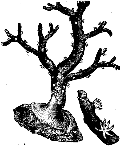
Branche de corail.

frappée par des maux humains; c'est la main divine qui l'écrasa en quelques instants. — Naza-