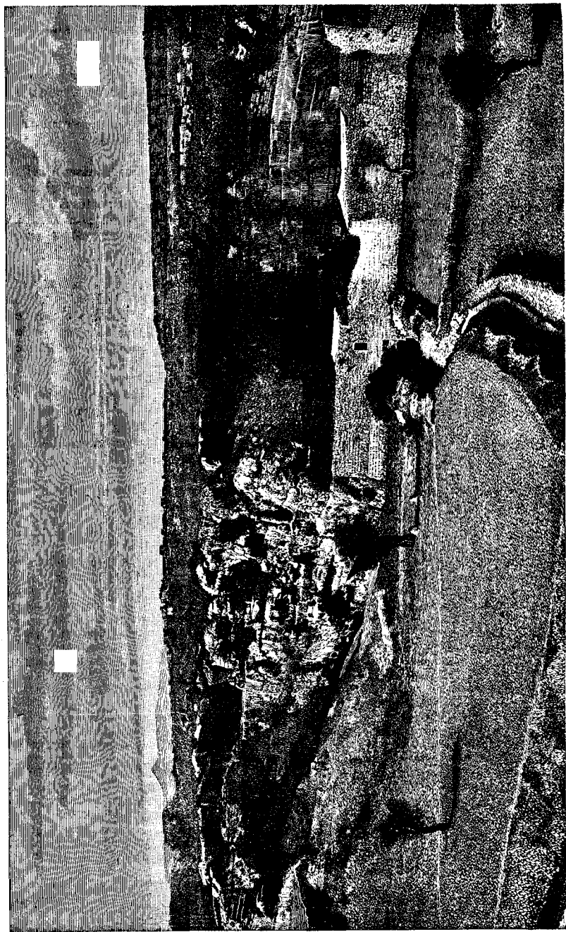
La grotte de Jérémie, à Jérusalem.