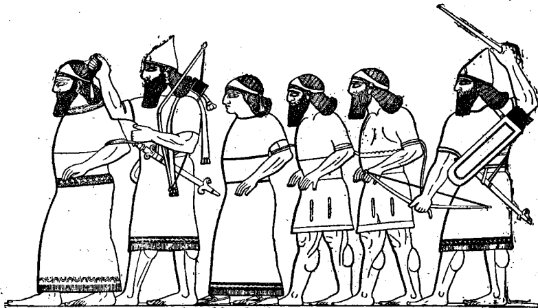
Prisonniers de guerre emmenés en captivité. (Bas-relief de Ninive.)

cavit ... (vers. 8). Elle a grandement péché. Voyez la note du vers. 5. — Instabilis facta ... L'hébreu a une autre image : Elle est devenue un objet d'horreur. — Viderunt ignominiam ... Hébr. : sa nudité; « l'état de nudité déshonorant