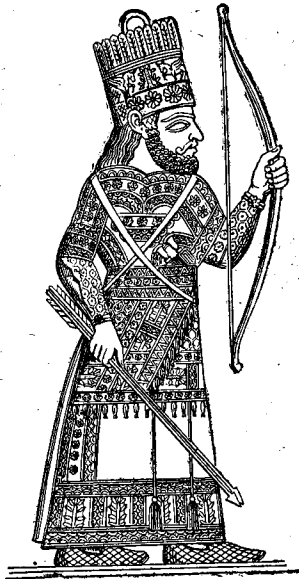
Roi chaldéen lançant des flèches. (Musée britannique.)

gné son sanctuaire, le temple, qui est désigné